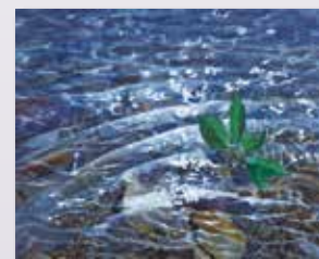
▲ 上善弱水 2