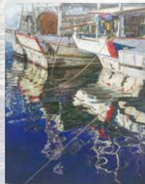
▲ 倒映 (三)