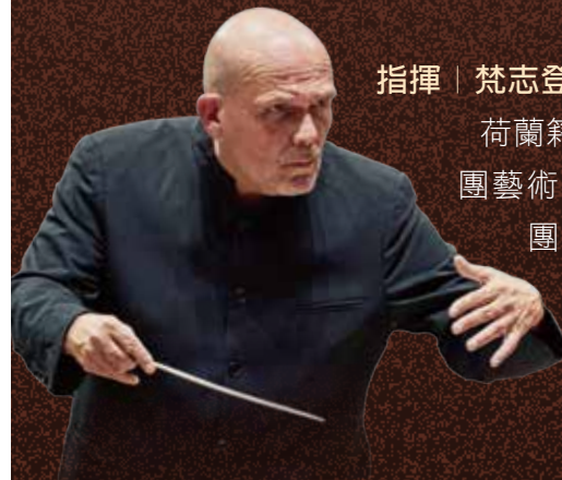
指揮 | 梵志登 Jaap van Zweden

當演出足跡遍及各個世界級舞台的鋼琴奇才周善祥，遇上由指揮大師梵志登所帶領的長榮交響樂團，這將是一場橫跨時代、文化與人性的音樂探索！從莫札特的古典風華，到拉赫瑪尼諾夫與蕭斯塔科維契在 20 世紀的情感辯證，三部作品各自展現作曲家獨特的音樂風格。