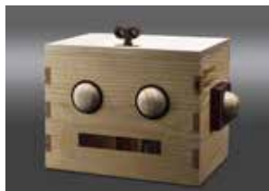
丁元茜《機器人說秘密》