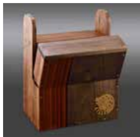
黃湘智《行走的恆星》