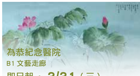
為恭紀念醫院 B1 文藝走廊