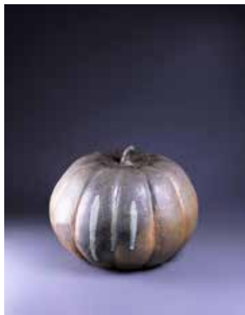
吳明儀《柴燒陶—南瓜茶倉》