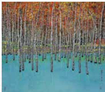
《杉林溪忘憂森林（之秋）》

其彩墨作品傳承中國畫傳統，題材來自對大自然的感悟與體會，對中國文化精神內涵的探索甚具心得。近年來常行走於海峽兩岸及日本，遍遊山川，在長期的藝術實踐中積累了豐富的創作經驗，廣集題材，作品以寫生為主，配合自身對藝術理念之意識，再加以組合創作，從接近大自然中，能「放懷於天地外，得氣在山水間」，並以「外師造化，中得心源」為創作依據。