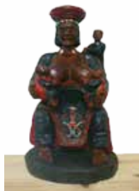
陳金益《偉大的母親》

本次展覽為陳金益從原住民生活中尋找題材，觸動自身對現實生活與社會活動的深層感受，參用原住民粗獷的雕法和突出獨特的圖騰、文物斑斕裝點，在原民風情中滲入西方現代藝術中表現主義式的強烈情感所展現的精彩作品。