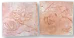
劉憶勳《出水芙蓉》、《鍾馗大師》