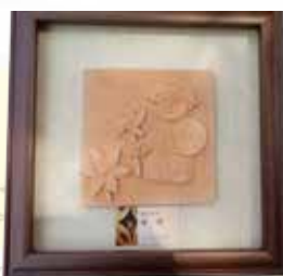
劉憶勳 《童玩系列一風車》